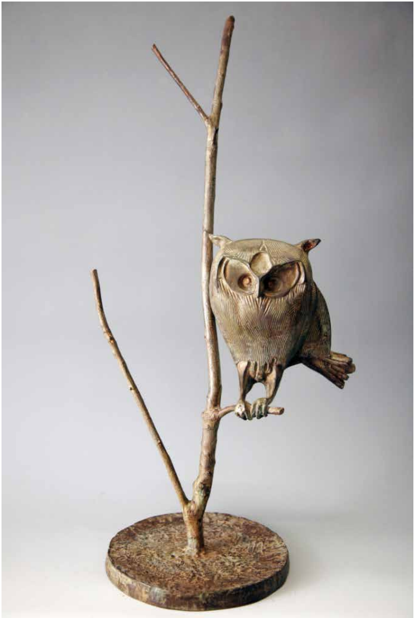
GUFO SU RAMO BASSO, H CM 80