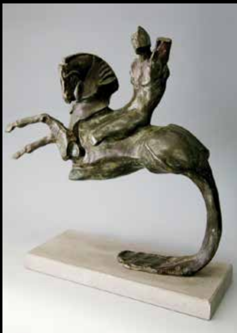
DON CHISCIOTTE H CM 29, BRONZO