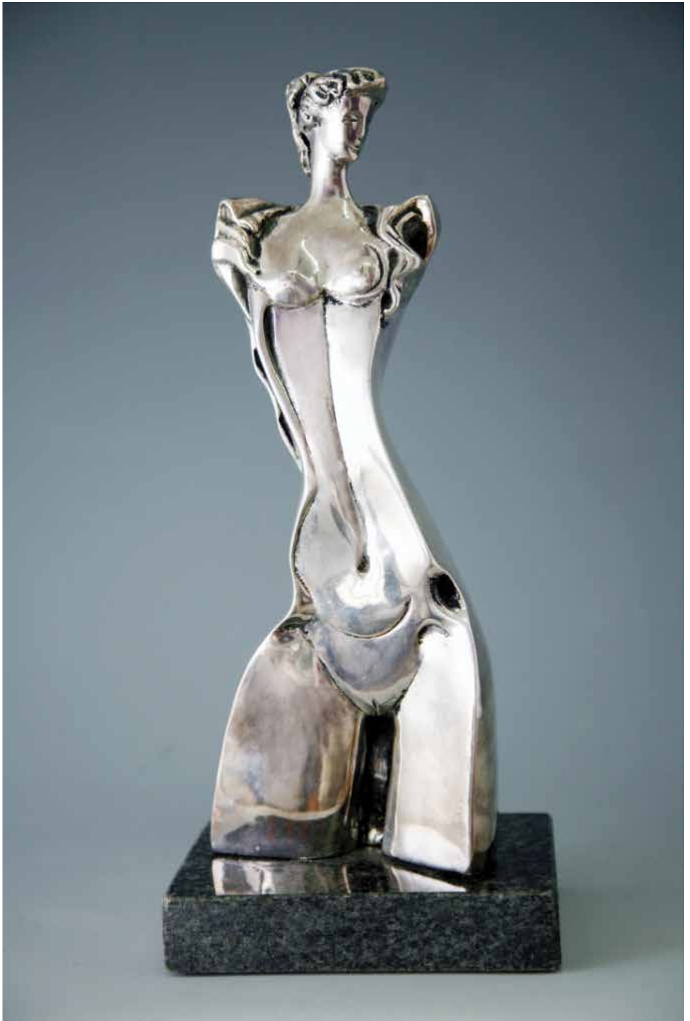
VENERE, H CM 33