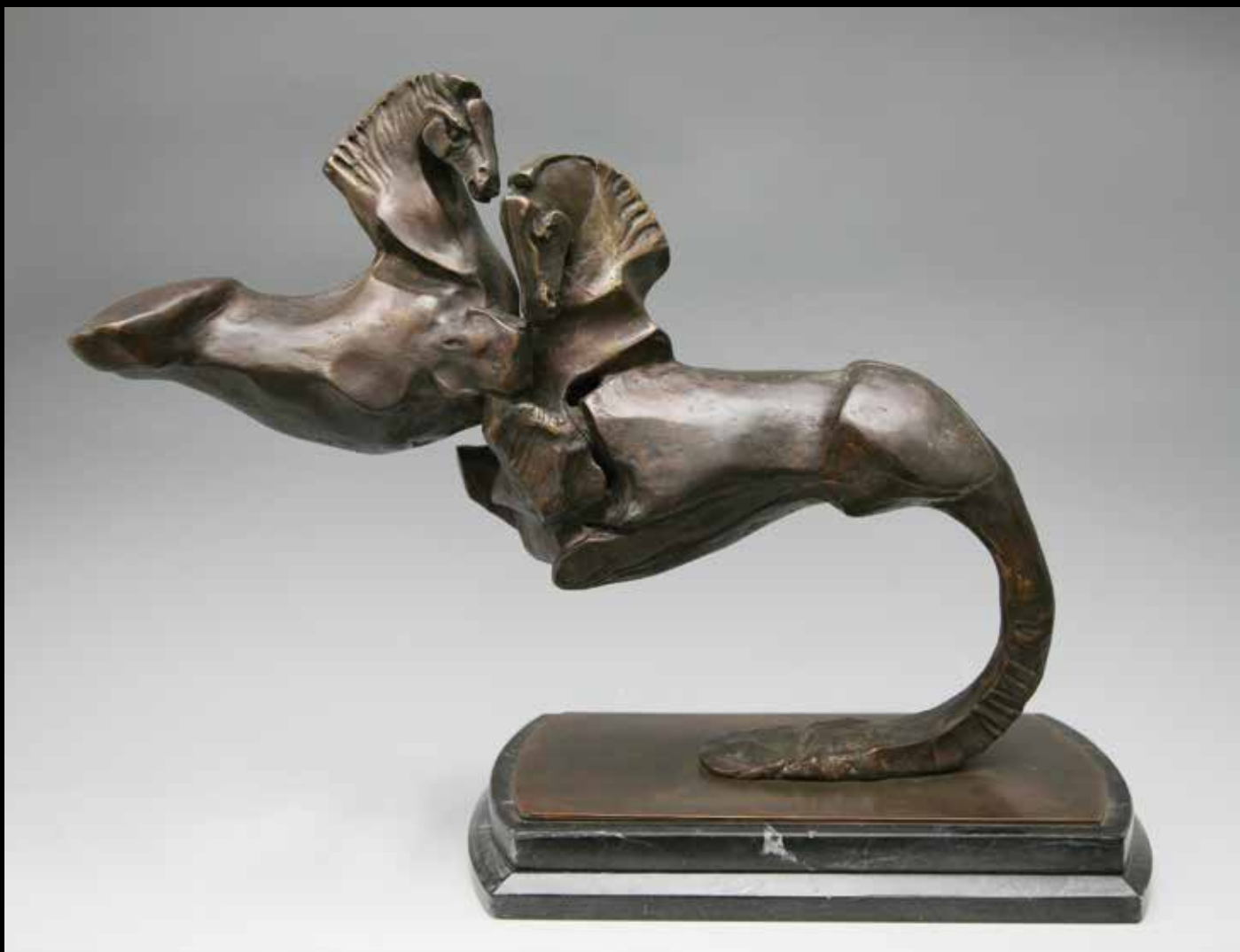
COPPIA DI CAVALLI, 1997, H CM 36, BRONZO