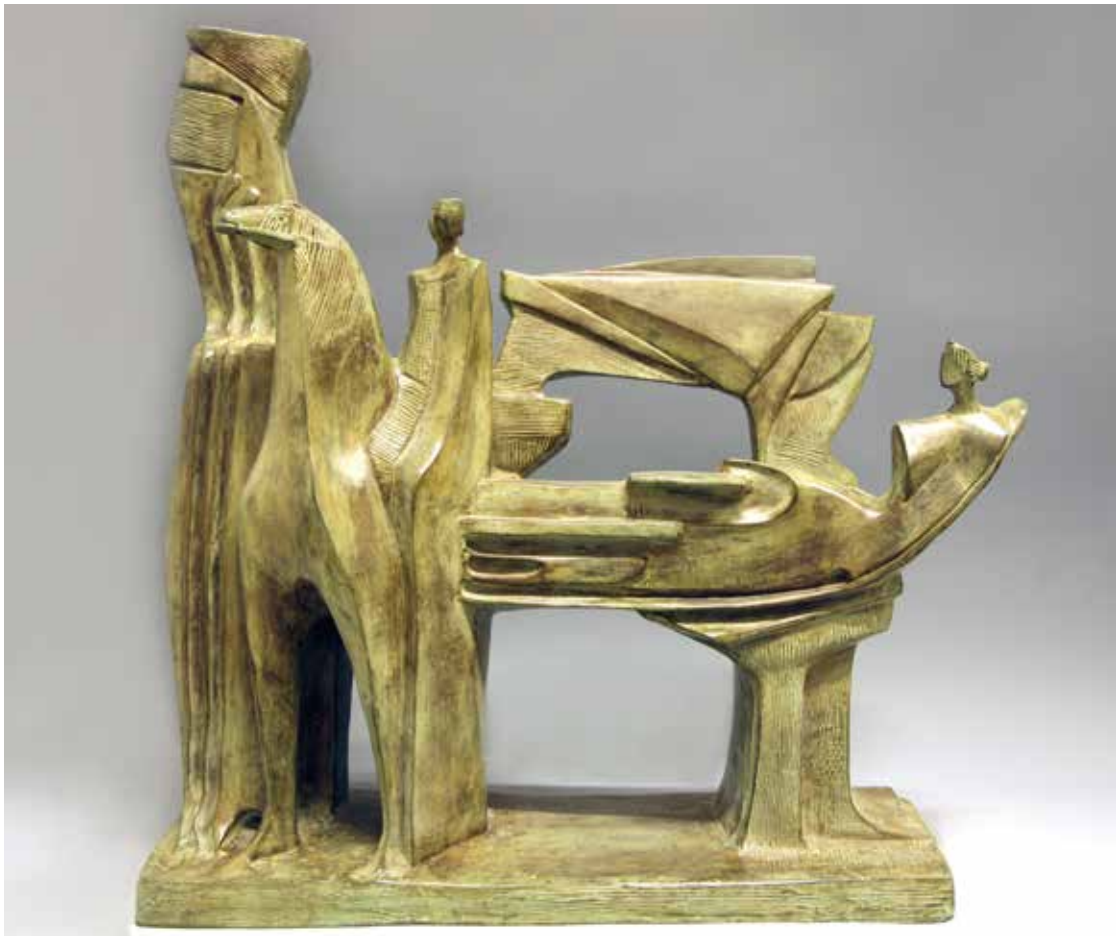
L'INCONTRO, 2006, H CM 64, BRONZO