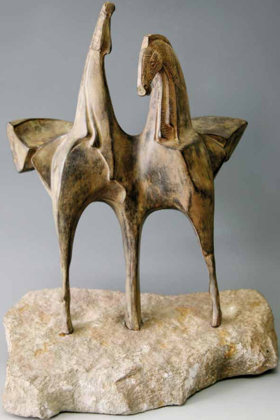
COPPIA DI CAVALLI SU SASSO, 2005, H CM 50, BRONZO