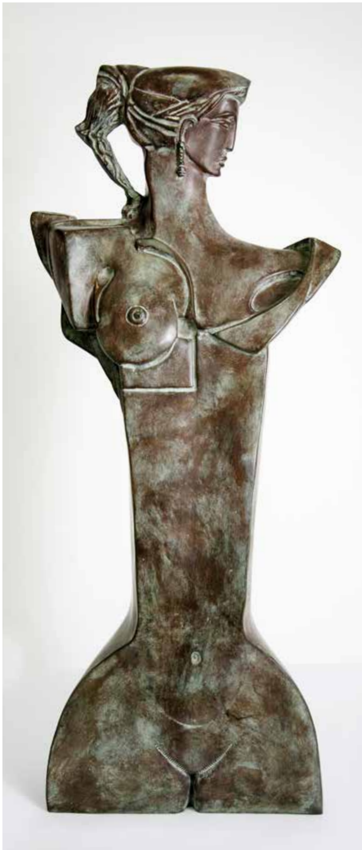
NAUSICA, 2010, H CM 83, BRONZO