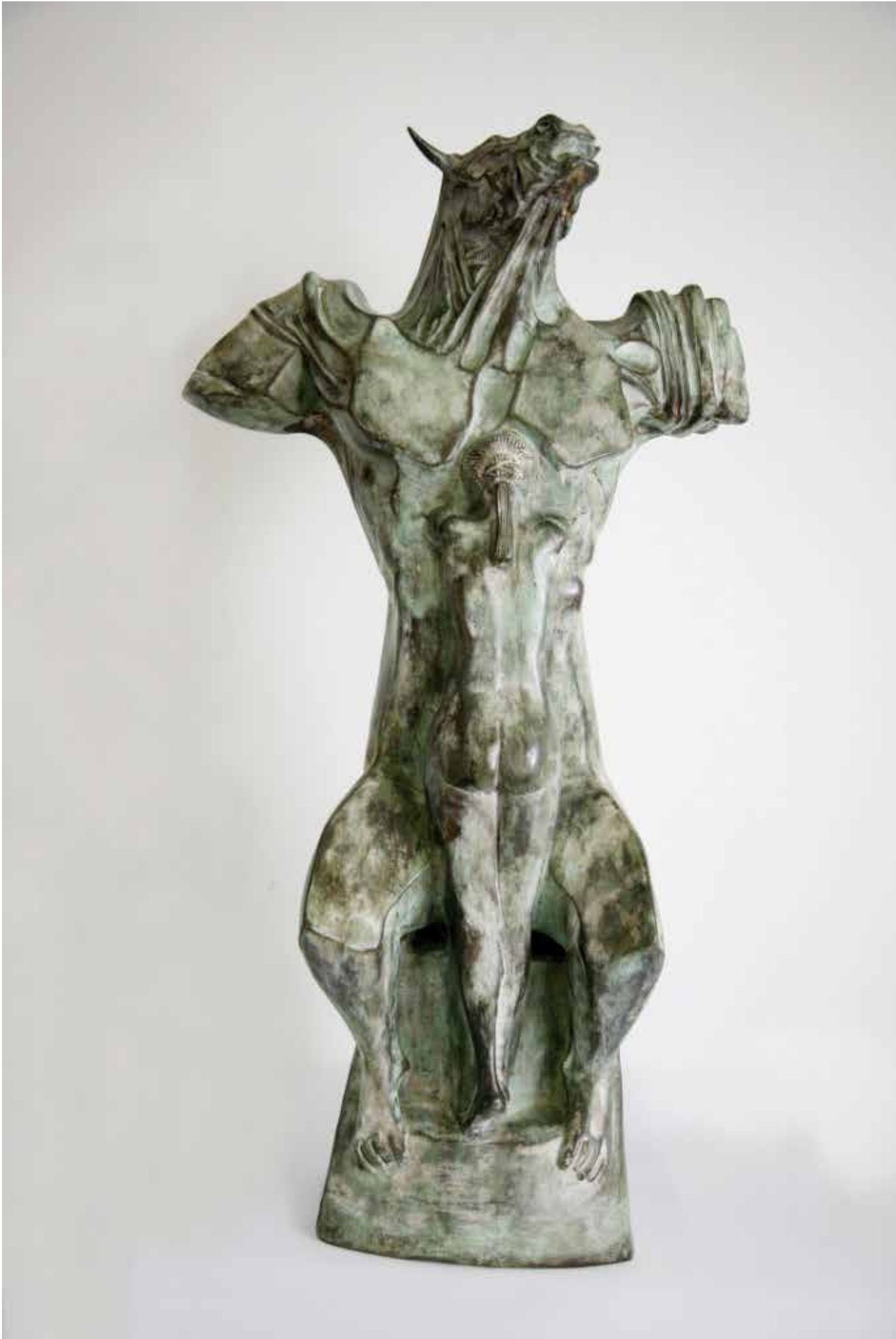
MINOTAURO E ARIANNA, H CM 80