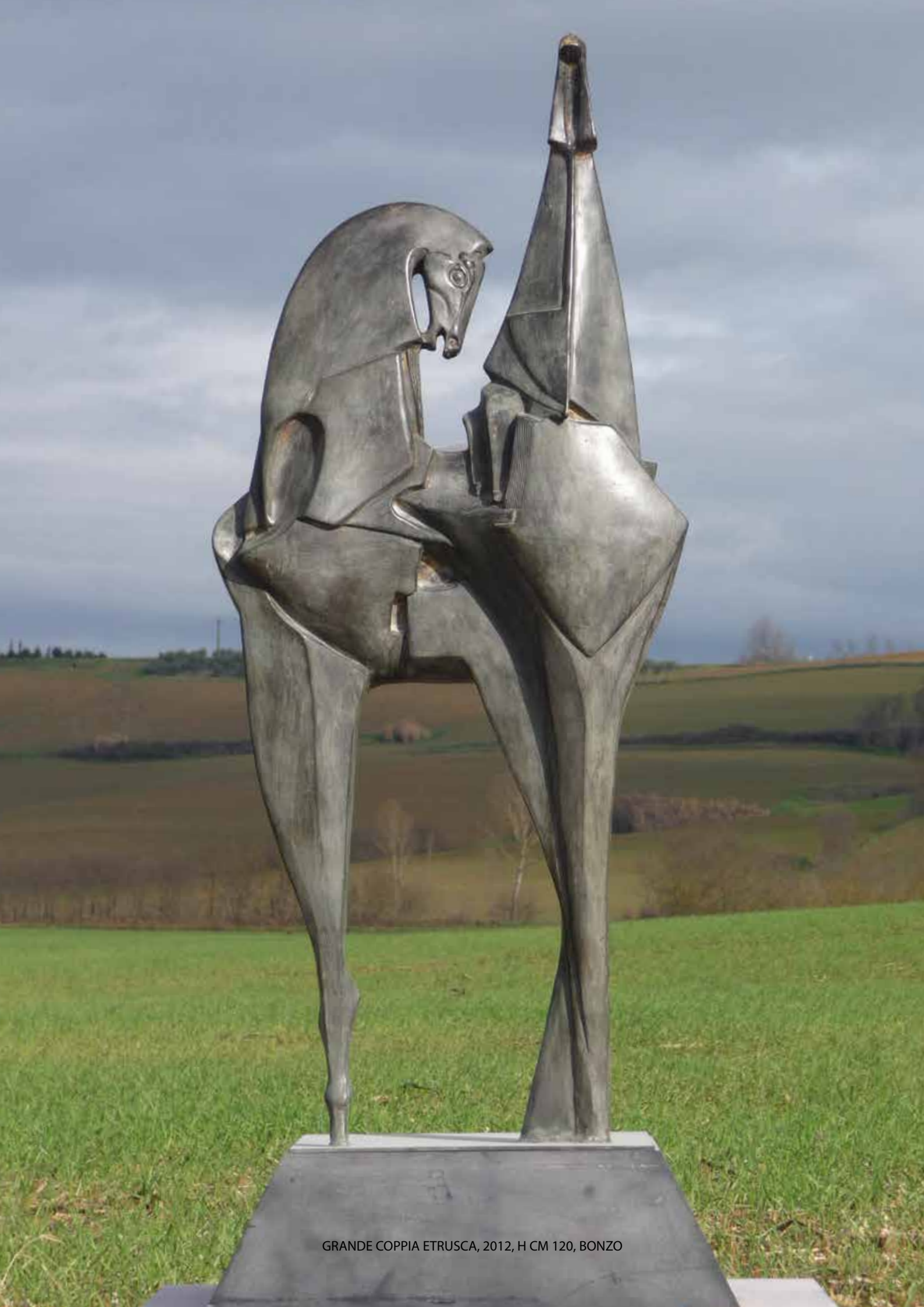
GRANDE COPPIA ETRUSCA, 2012, H CM 120, BONZO