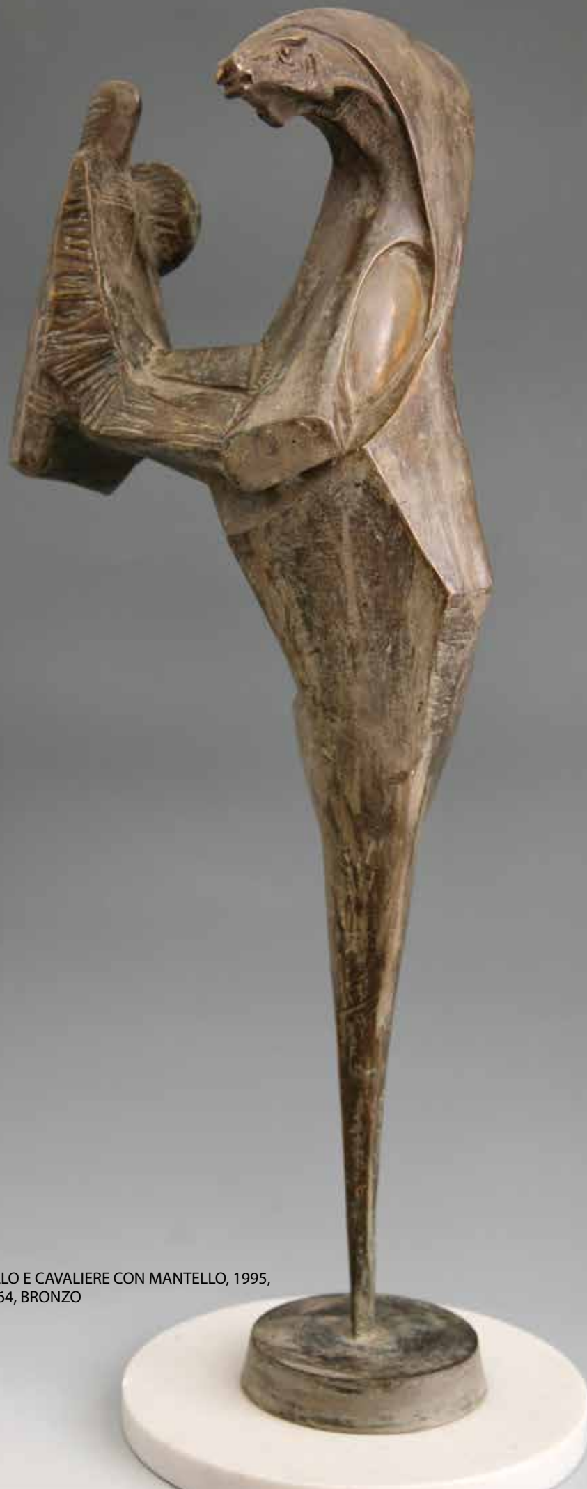
CAVALLO E CAVALIERE CON MANTELLO, 1995, H CM 64, BRONZO