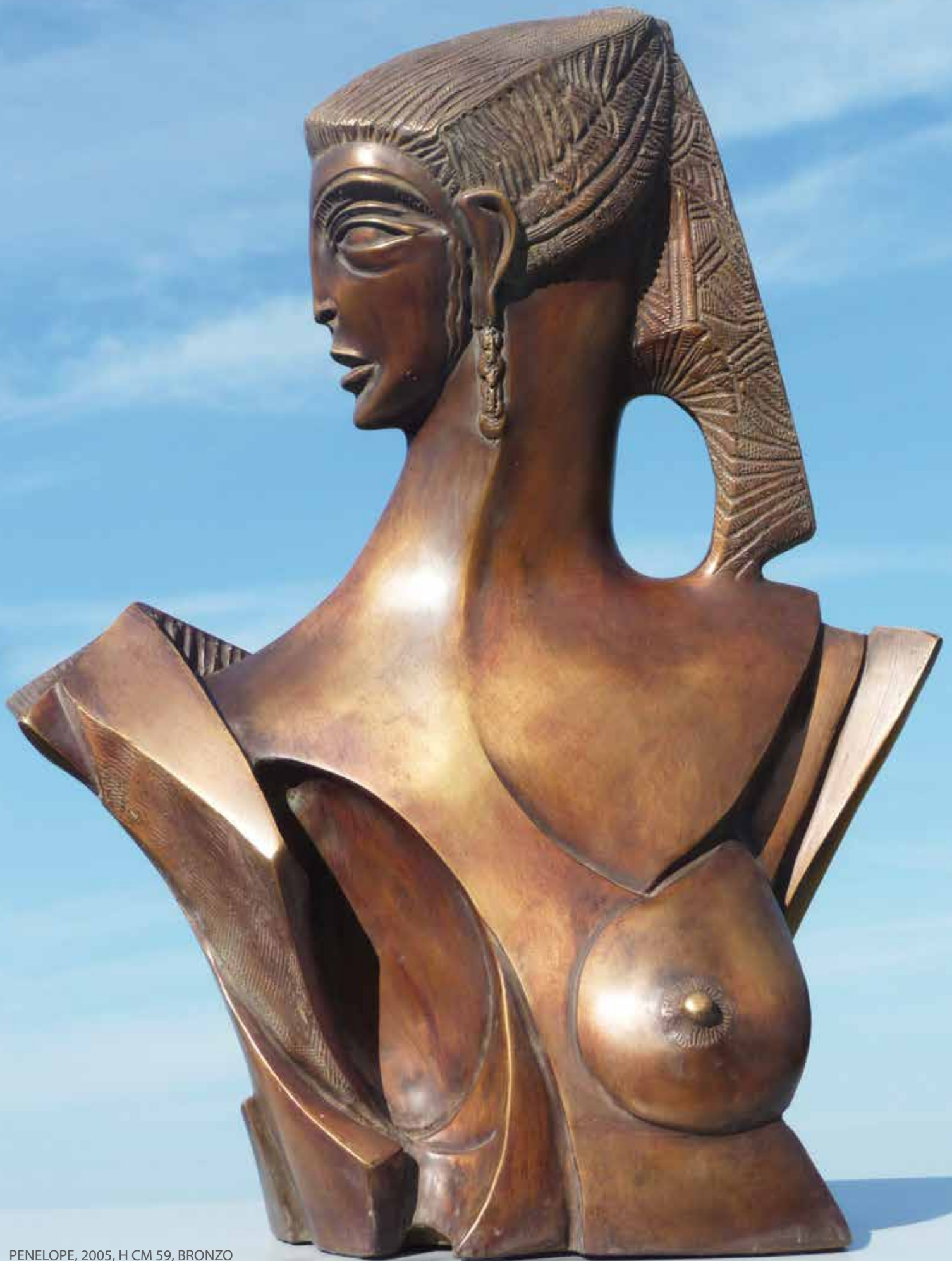
PENELOPE, 2005, H CM 59, BRONZO