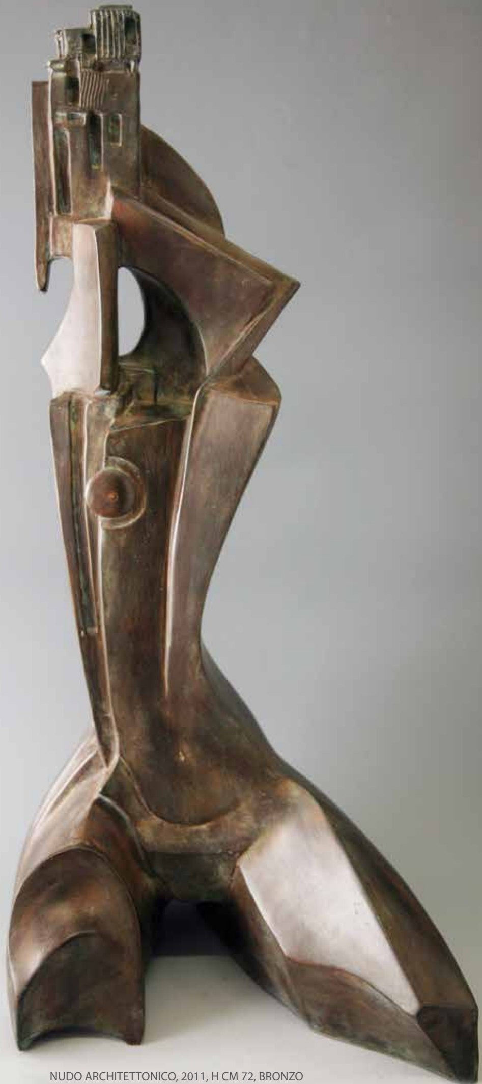
NUDO ARCHITETTONICO, 2011, H CM 72, BRONZO