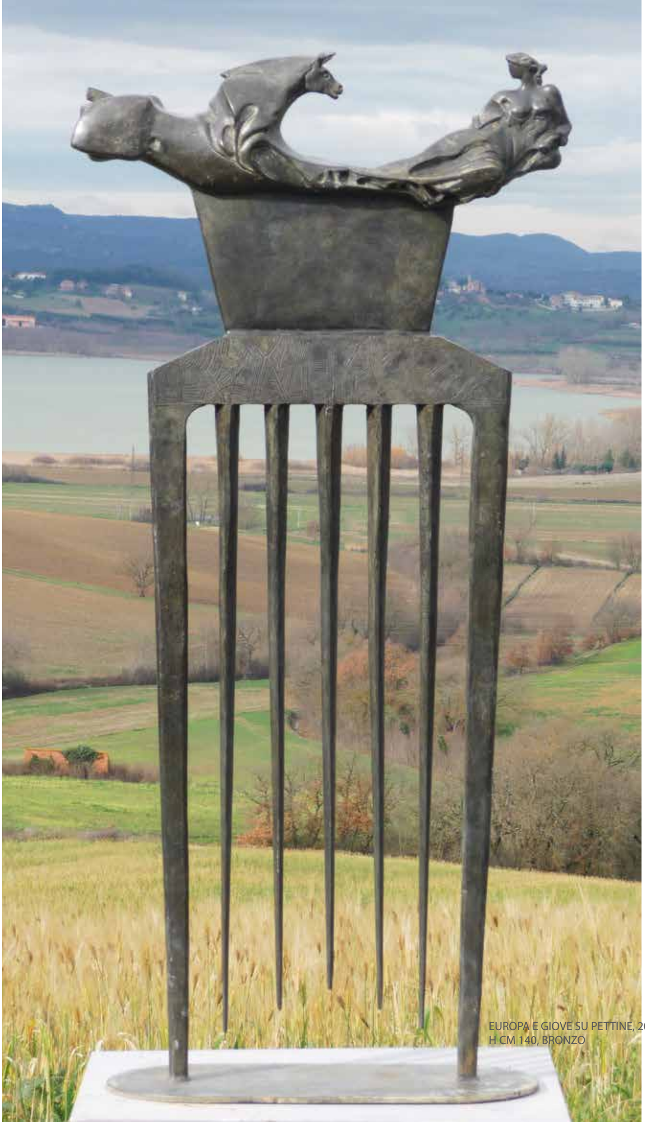
EUROPA E GIOVE SU PETTINE, 2012, H CM 140, BRONZO