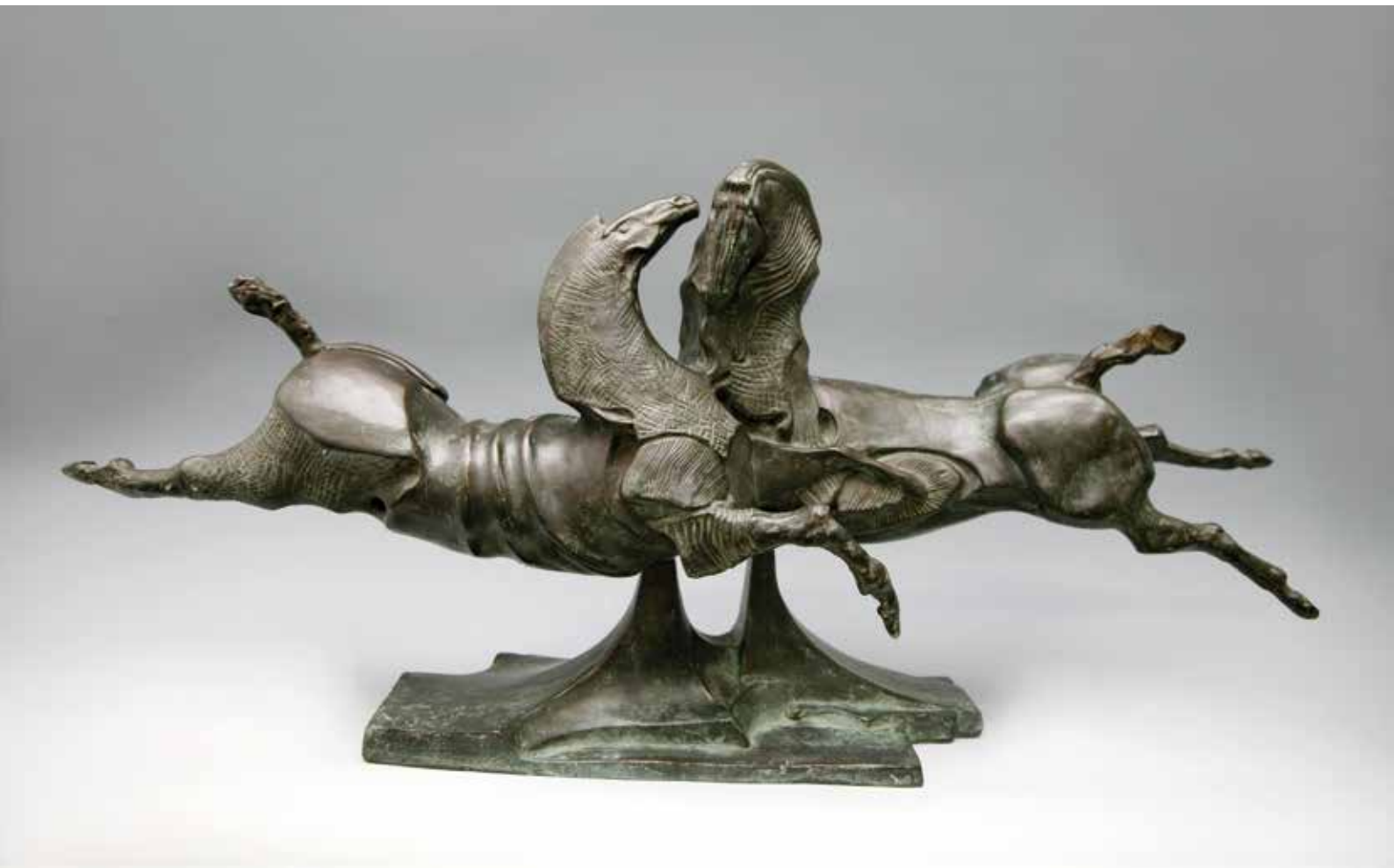
COPPIA CAVALLI INTRECCIATI, 1998, H CM 50, BRONZO