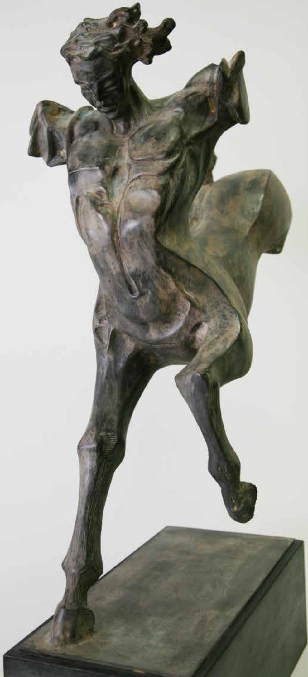
CENTAURO, 2012, H CM 66, BRONZO