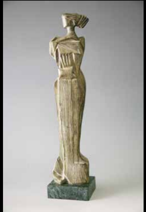
SIBILLA, 2012, H CM 38, TERRACOTTA SIBILLA, 2000, H CM 41, BRONZO SIBILLA, 2000, H CM 40, BRONZO