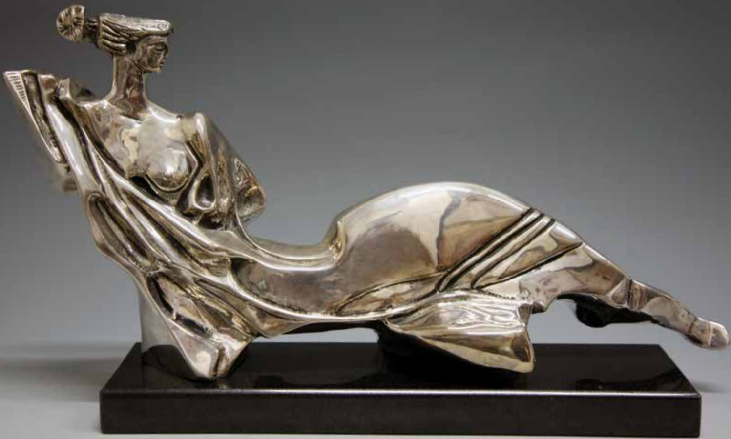
L'ETRUSCA, 2010, H CM 25, BRONZO ARGENTATO