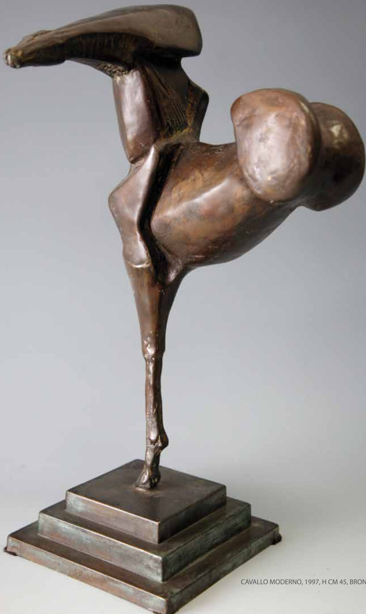
CAVALLO MODERNO, 1997, H CM 45, BRONZO