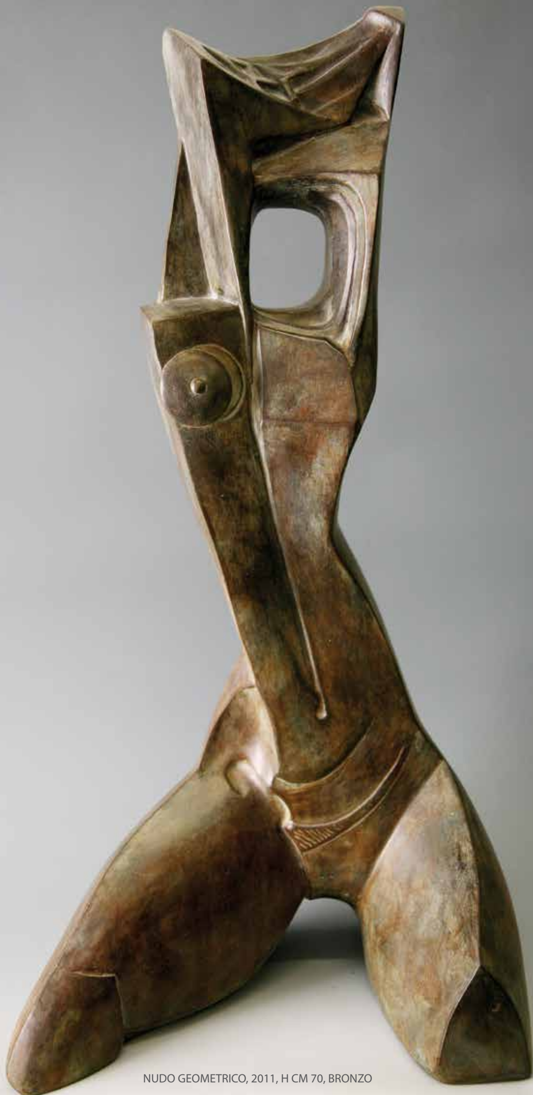
NUDO GEOMETRICO, 2011, H CM 70, BRONZO