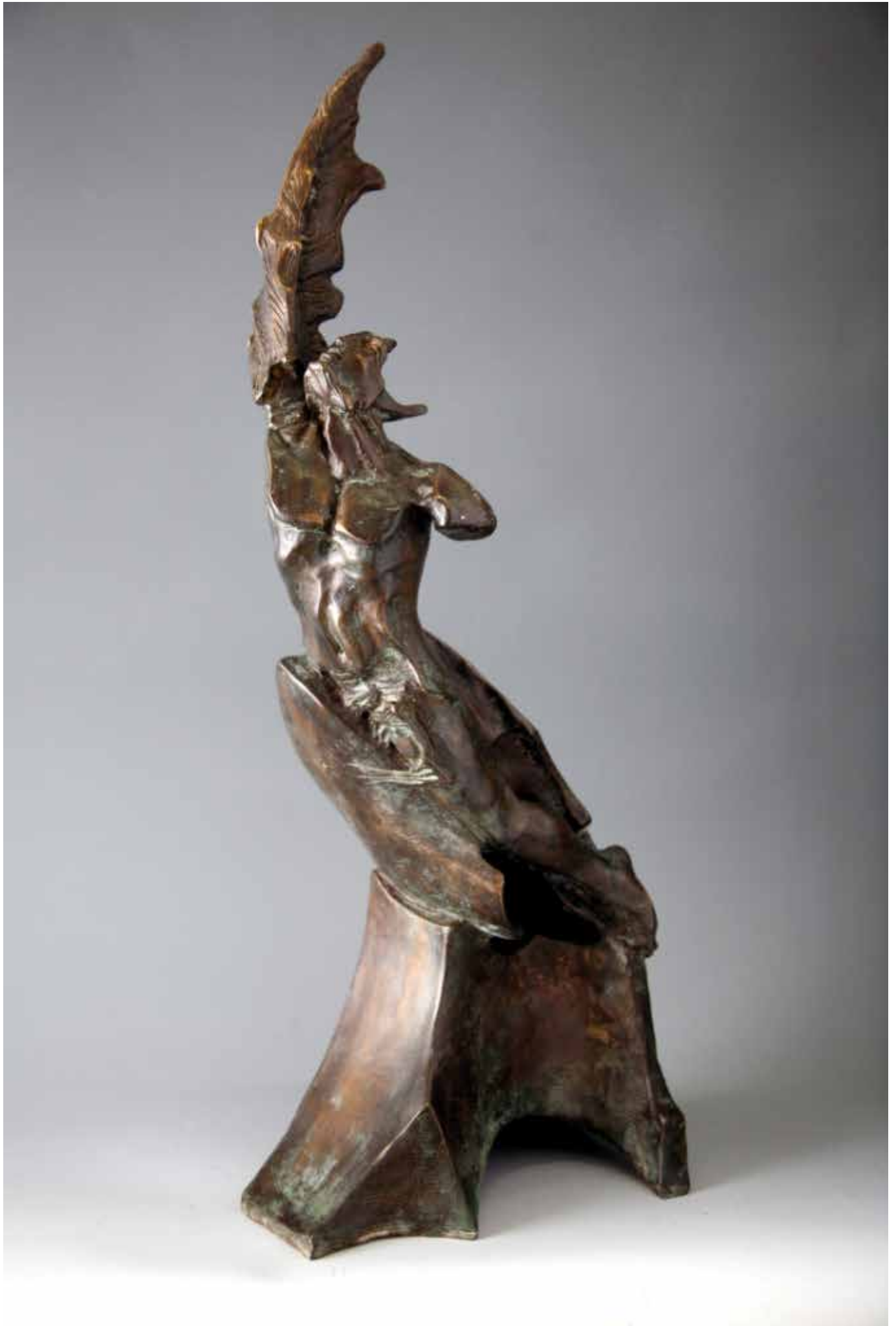
ICARO CON ALA, H CM 63