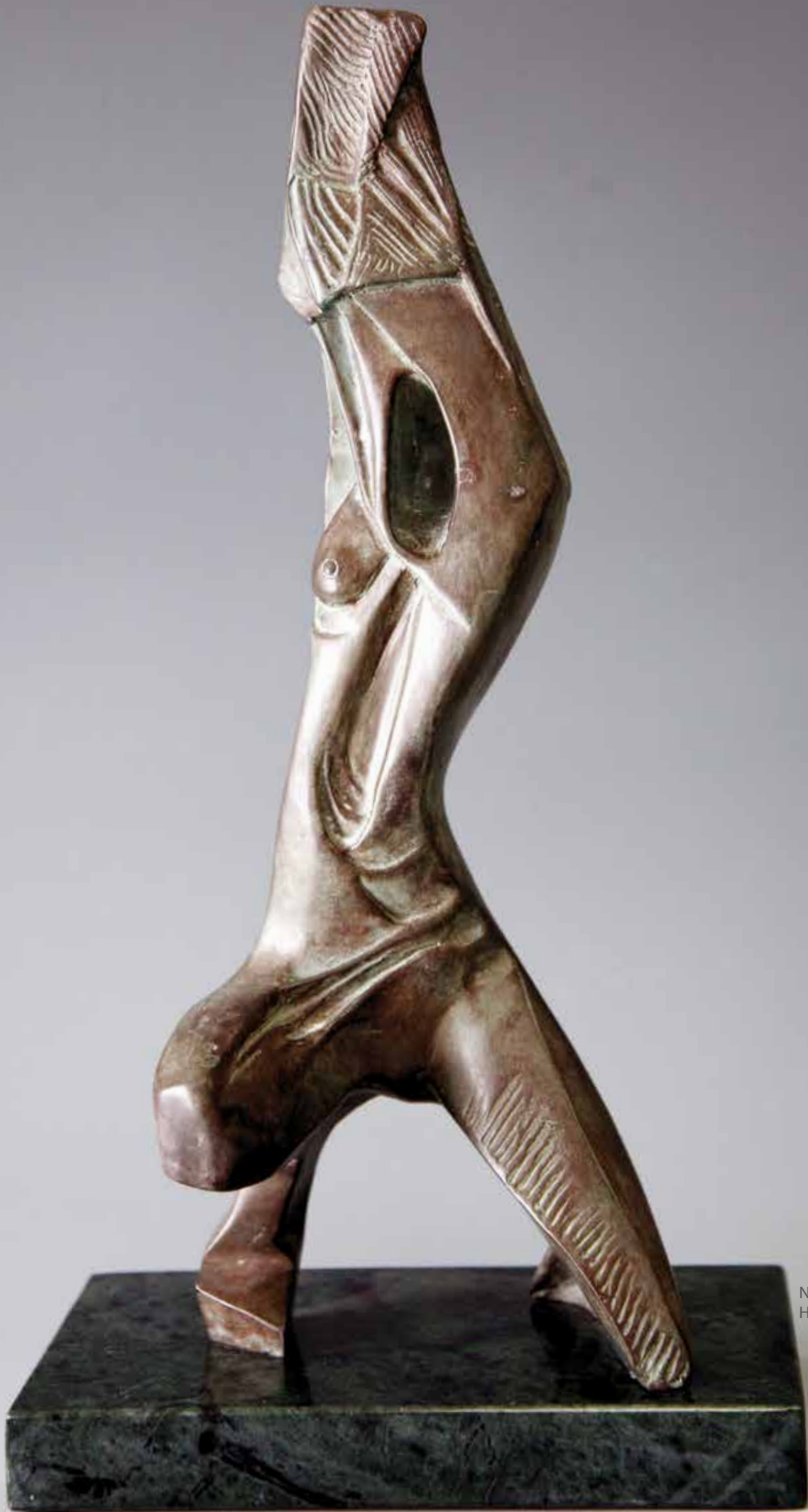
NUDO INGINOCCHIATO, 2011 H CM 38, BRONZO