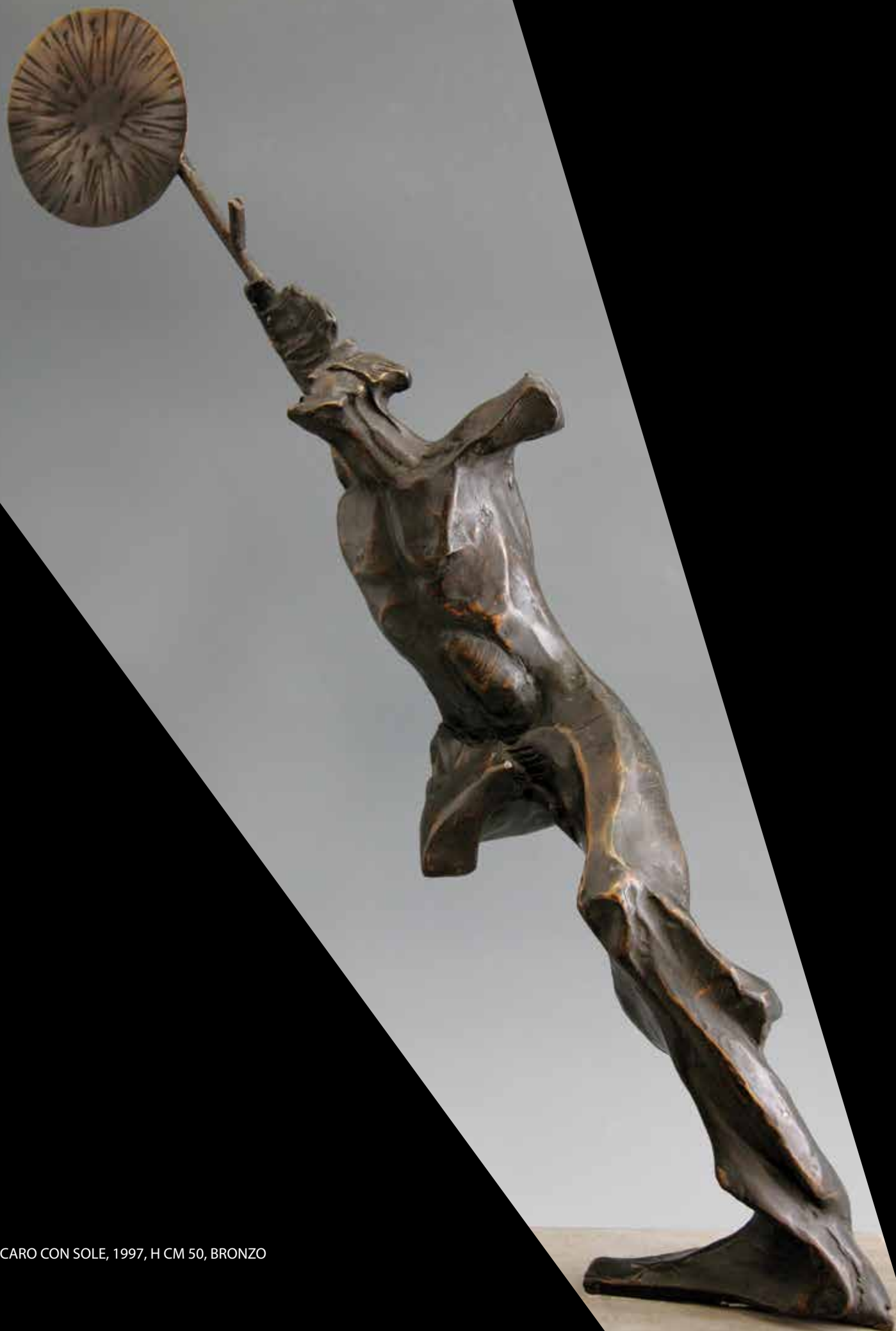
ICARO CON SOLE, 1997, H CM 50, BRONZO