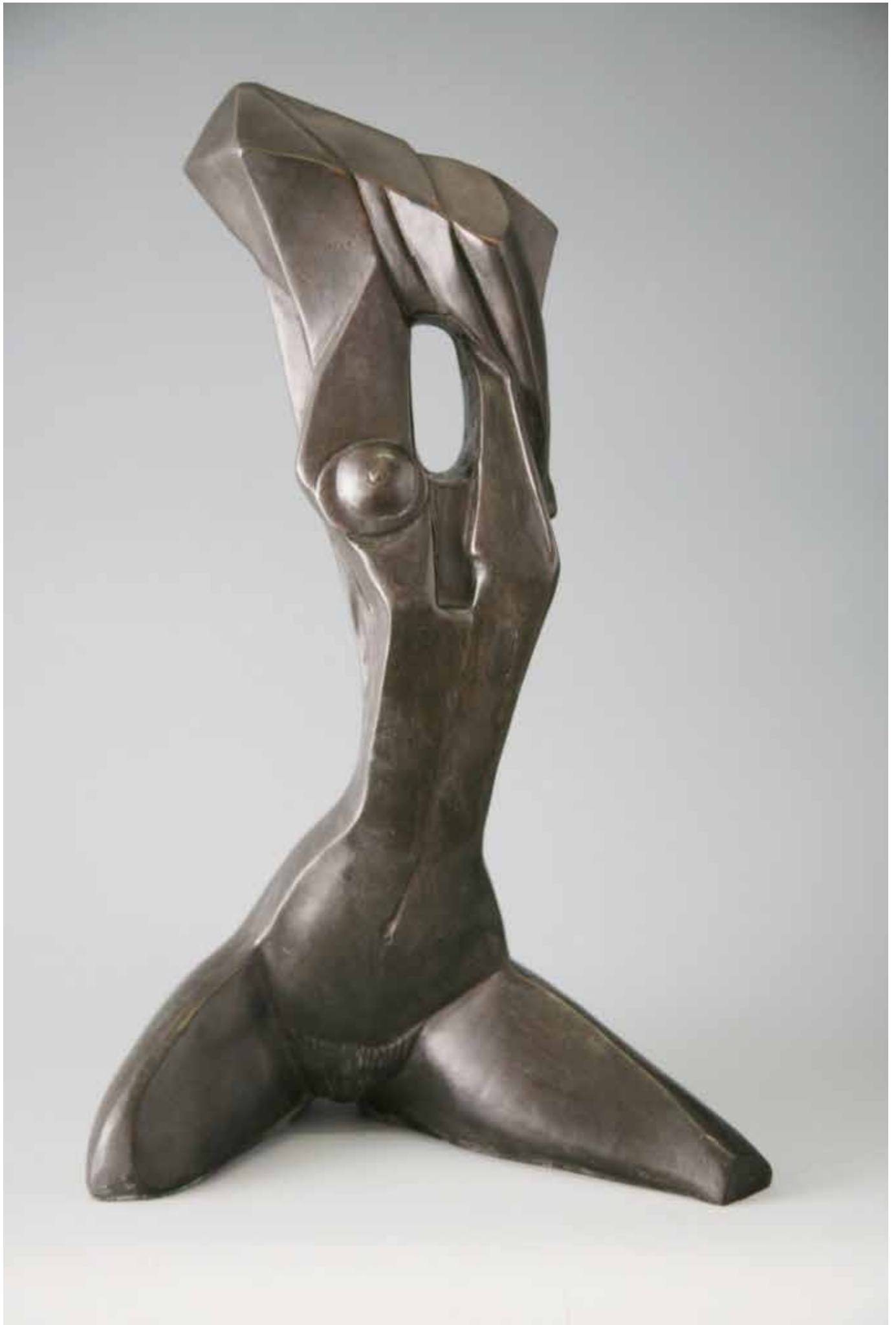
NUDO GEOMETRICO, H CM 45