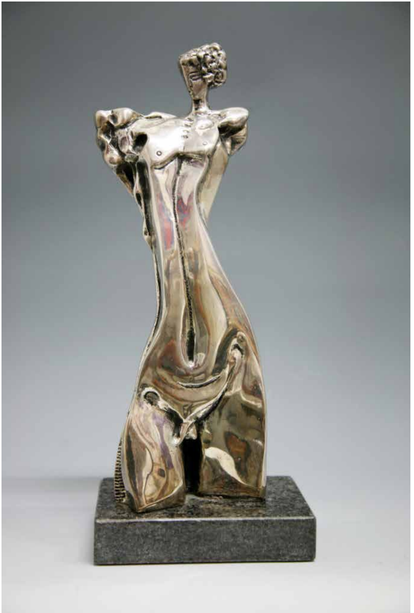
PARIDE, H CM 32