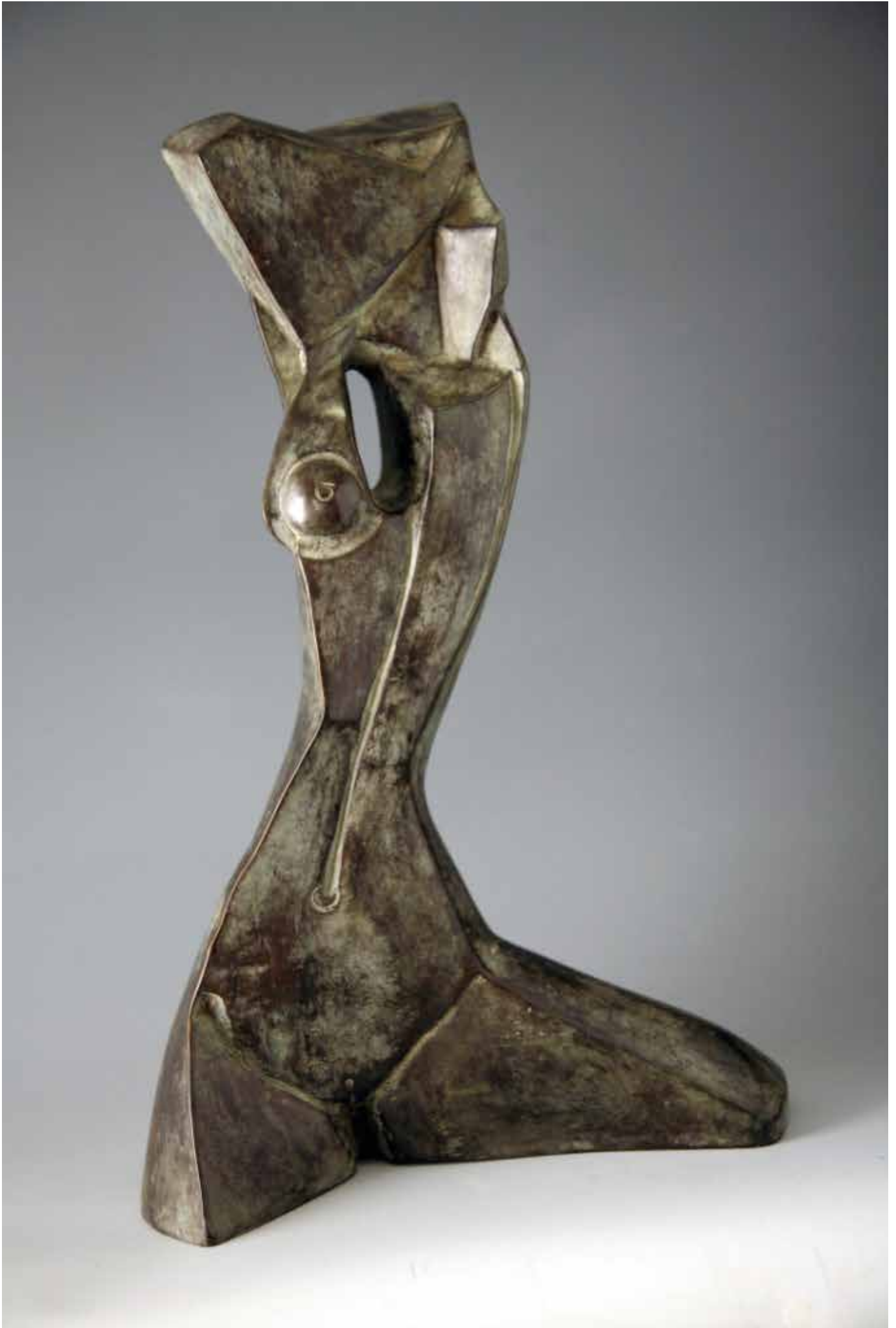
NUDO SINUOSO, H CM 47