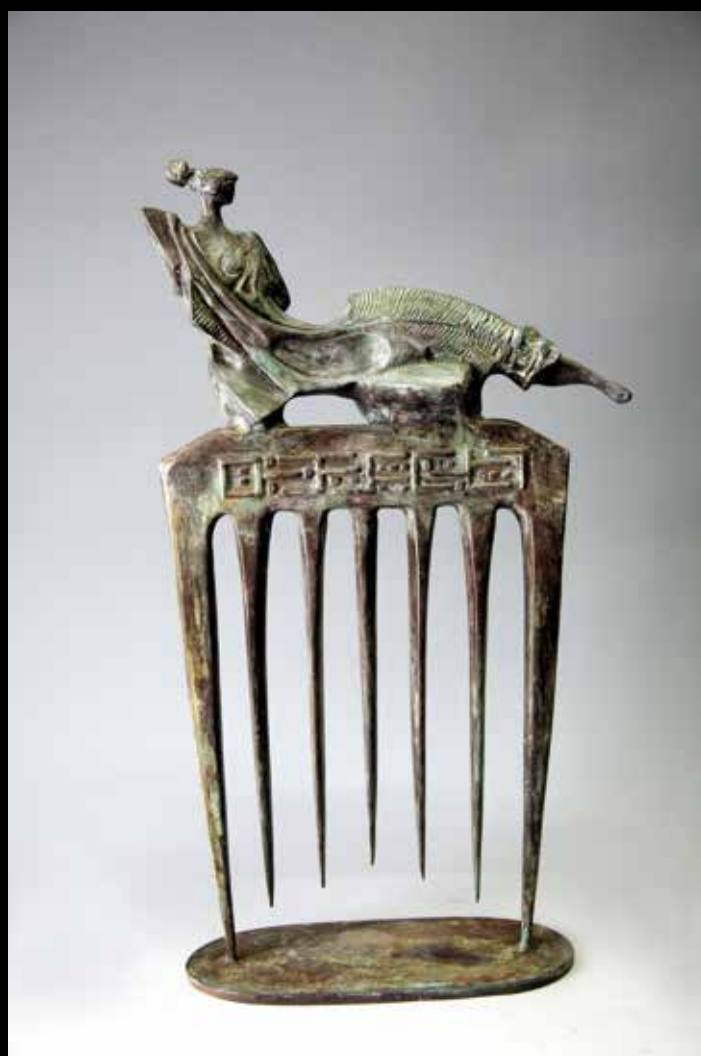
INCONTRO SU PETTINE, 2012, H CM 83, BRONZO