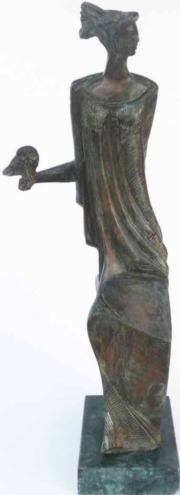
ATENA, 2012, H CM 44, BRONZO