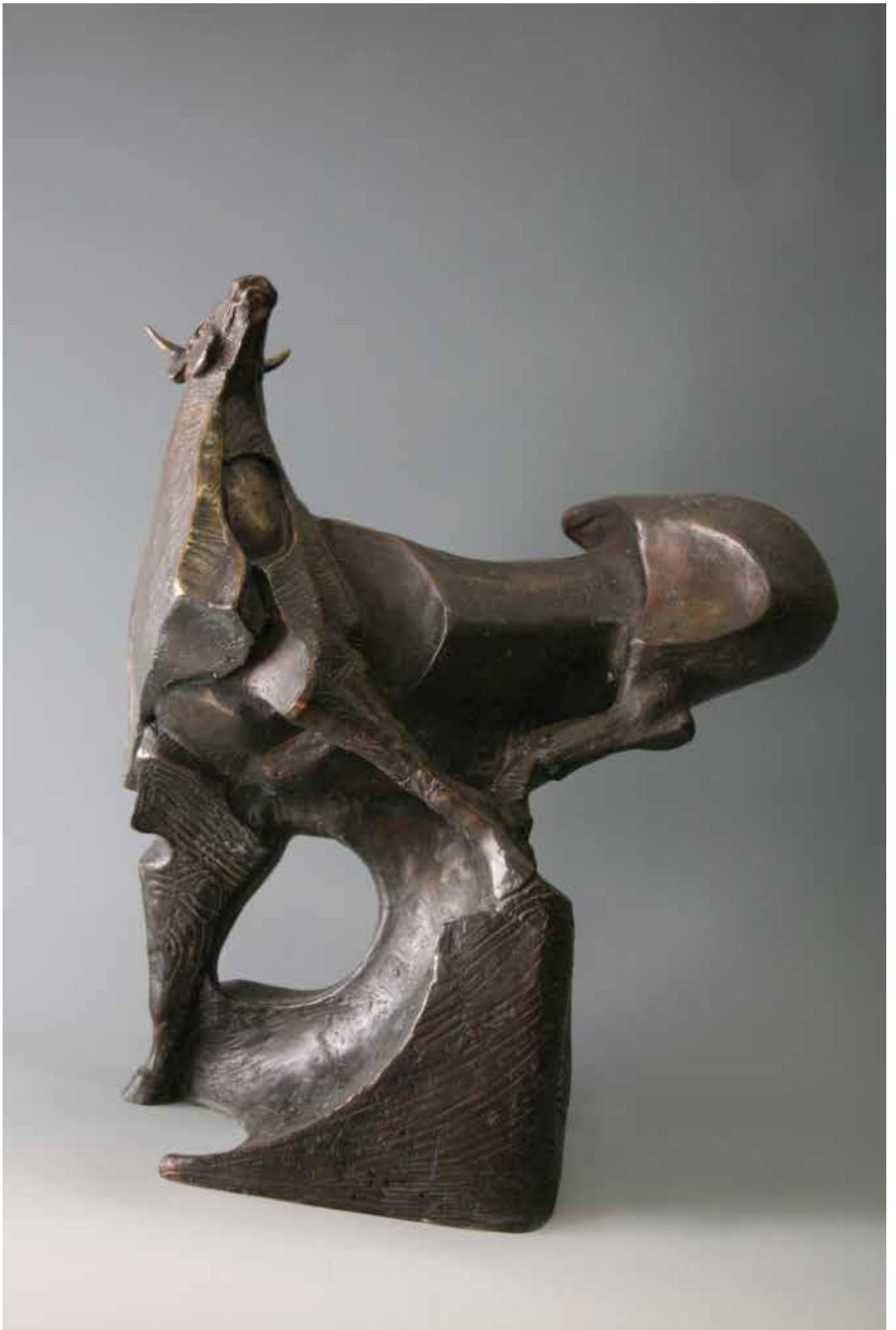
TORO H CM 45