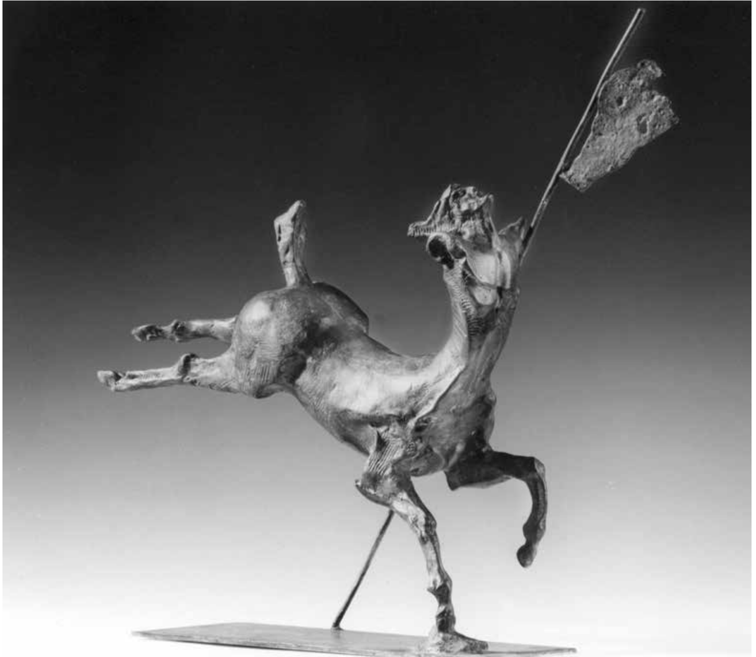
CENTAURO CON STENDARDO, 1997, H CM 43, BRONZO