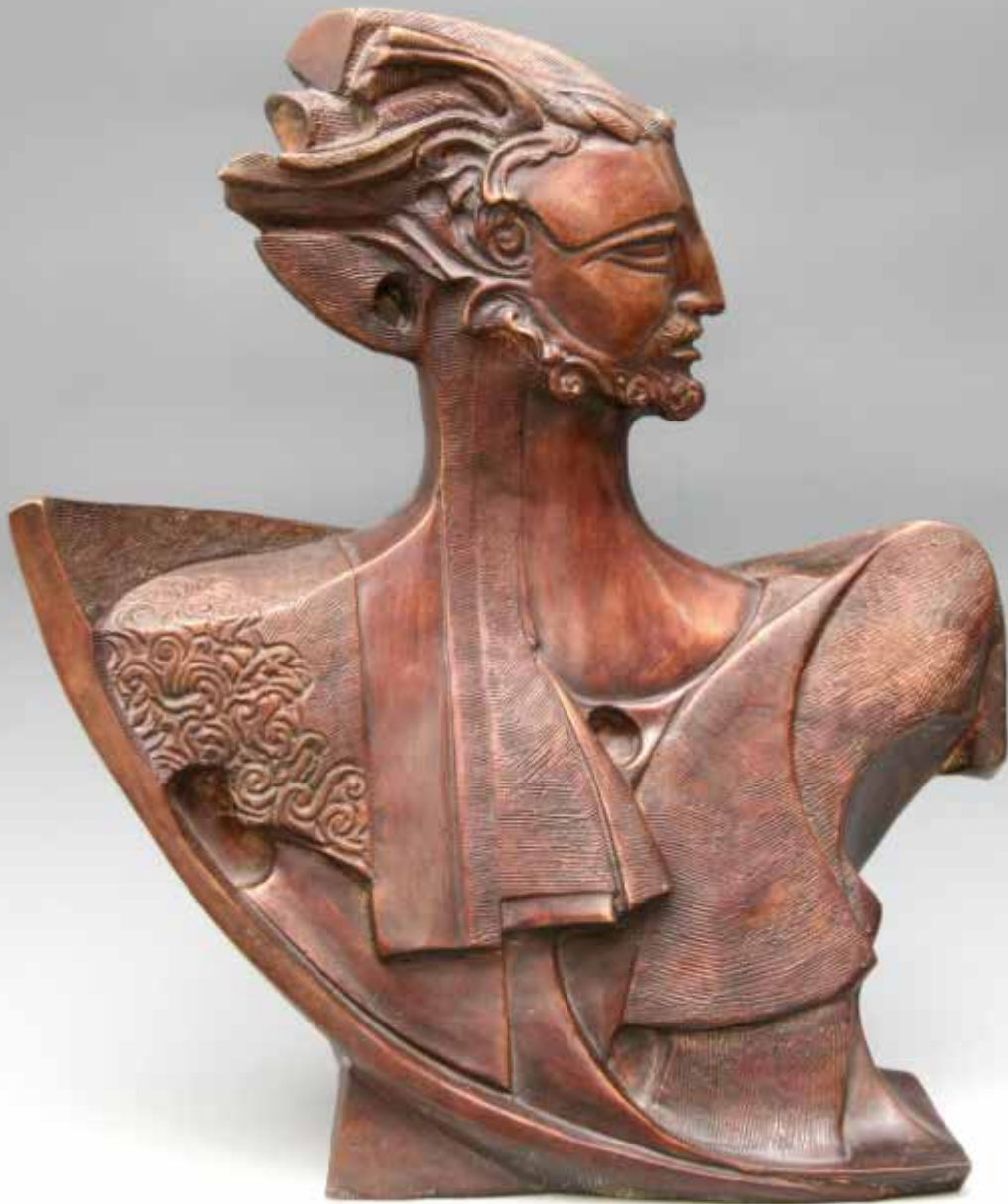
ULISSE, H CM 64